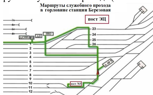
Рис.1 Маршруты служебного прохода для передвижения работников в южной горловине станции

Передвижение работников ж.д. транспорта по станции Березовая в южной горловине, должно осуществляется согласно маршрутам служебного прохода (выписка из ТРА), смотри Рис.1.