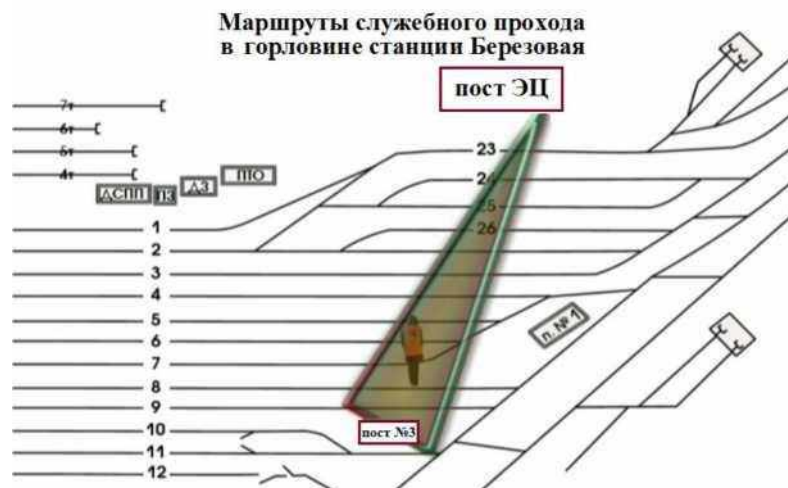
Рис.3 Визуальный контроль во время работы маневрового диспетчера