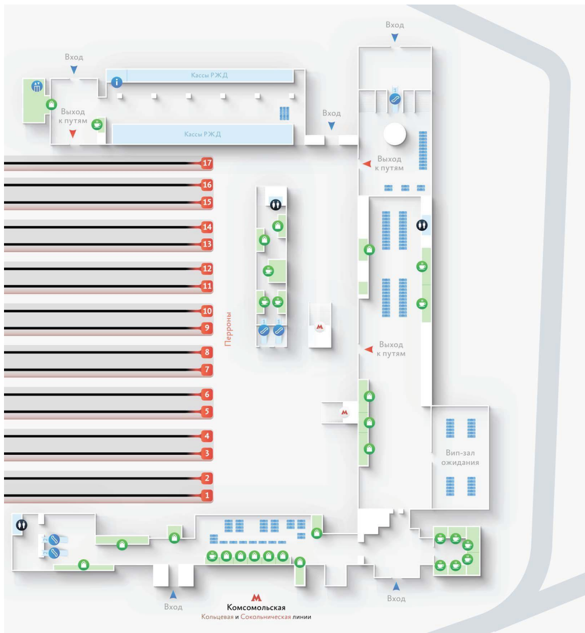
Рисунок 1.1 – Схема Казанского вокзала

Задание 1. Организовать маршрут беспрепятственного следования маломобильного пассажира на внеклассном вокзальном комплексе. План вокзального комплекса представлен на рис.1.1. Для заданного вокзального комплекса разрабатывается ряд мероприятий и выбирается маршрут беспрепятственного следования маломобильного пассажира согласно СТО РЖД 03.001-2014.