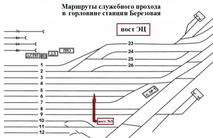
Рис.2 Маршрут передвижения сигналиста Виноградовой А.П. в южной горловине станции

Сигналист, в виду свободы путей от подвижного состава по 7С, 8С и 9С пути, устремилась к стоящему по 5С пути поезду №3003 по кратчайшему пути, игнорируя служебные проходы, смотри Рис.2 (нарушение условий передвижения по ж.д. путям работника станции к месту работ). Произвела закрепление поезда №3003 с юга двумя тормозными башмаками №345 и №344, после чего, устремилась обратным путем к посту №3 (повторное нарушение условий передвижения по ж.д. путям работника станции).