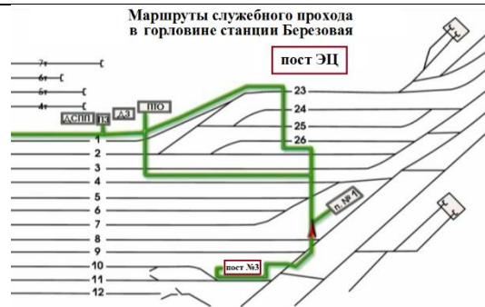
Рис.1 Маршруты служебного прохода для передвижения работников в южной горловине станции

Сигналист, в виду свободы путей от подвижного состава по 7С, 8С и 9С пути, устремилась к стоящему по 5С пути поезду №3003 по кратчайшему пути, игнорируя служебные проходы, смотри Рис.2 (нарушение условий передвижения по ж.д. путям работника станции к месту работ). Произвела закрепление поезда №3003 с юга двумя тормозными башмаками №345 и №344, после чего, устремилась обратным путем к посту №3 (повторное нарушение условий передвижения по ж.д. путям работника станции).